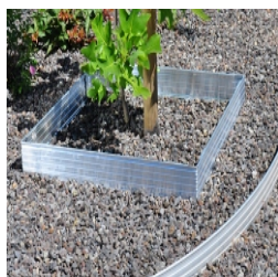
od 50 x 50, do 300 x 300 cm