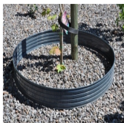
Ø30, 50, 75, 115 cm