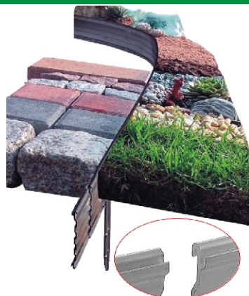
Teleskopowe połączenie bez śrub