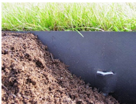
Befestigung mit Stahlanker